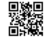
あまのわ最新情報

屋外のふれあいの森では、登録団体の「NPO 法人ママ・ぷらす」・「風土マルシェ実行委員会」・「あま×SDGs」・「ふれあいマルシェ菅津実行委員会」によるマルシェや、商工会のブースがたくさん並びます。お楽しみください。 ※出店詳細はHPをご覧ください。