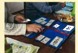
楽しくワークに参加

市内に営業所がある企業が、社会貢献活動として取り組んでいるお片付け講座は、シニアの皆さんの関心が高く、市内のサロンからの依頼が増えています。講座はワーク形式で行い、気心の知れた仲間と楽しく学べると好評です。また、要らなくても使えるからと手放せない人には、フリーマーケットへの出品や寄付を提案し、その機会を提供しています。人との交流の場にもなるフリーマーケットを、いずれはシニアの皆さんが主体的に運営してくれることを願っているそうです。