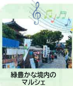
緑豊かな境内のマルシェ

協働とは、市民、地域組織、市民活動団体、事業者、行政等さまざまな主体が、同じ目的のためにそれぞれの強みを活かし協力して事業を行うことです。最近の協働事例を紹介します。センターのInstagramでも情報発信しています。